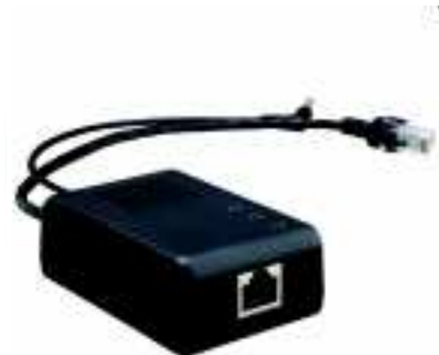
付属ケーブル 接続時のPS103