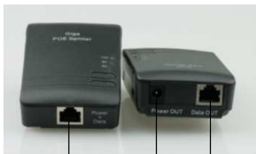
PoEポート (DATA+Power) 電源ポート (Power) LANポート (DATA)